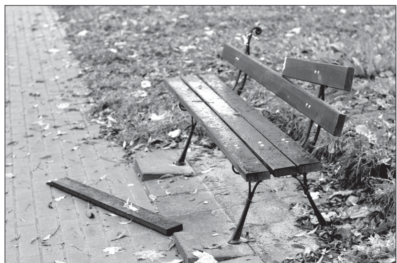
Kažkam užkliuvo net patogus suoliukas pailsėti...

Piktosios Žiurkės nusiskundimus parengė Pranas GAIDAMAVIČIUS